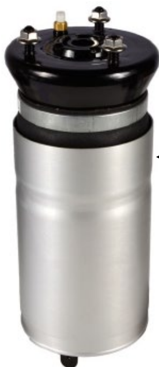
5. 1x Modulo di molla ad aria